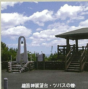
磯笛岬展望台・ツバスの鐘

太平洋を望む絶景地で「ツバスの鐘」を鳴らすと恋人達の願いが叶うと言われています。