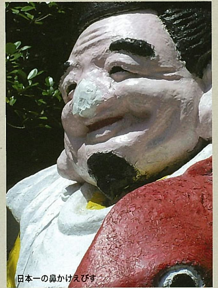
日本一の鼻かけえびす